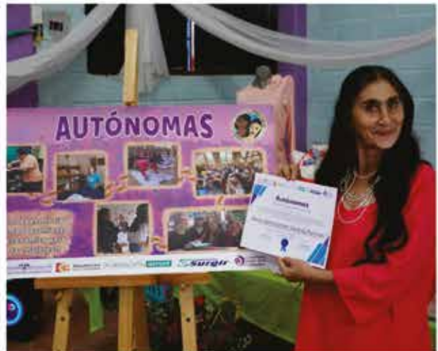
Imágenes de la clausura y cierre del proceso desarrollado con las participantes del proyecto Autónomas Comuna 3.