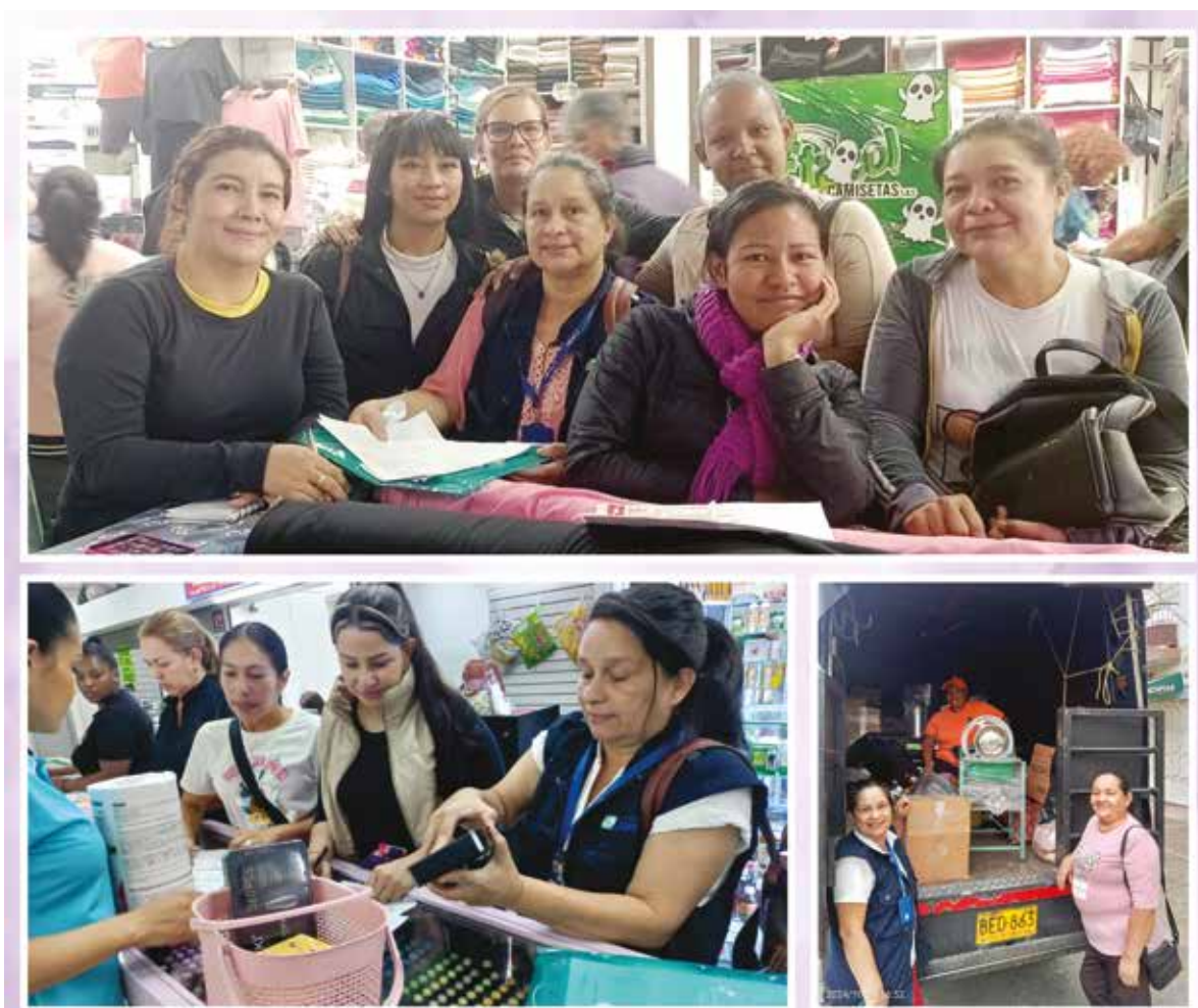
Participantes y autónomas acompañadas por la profesional de campo durante la compra de materiales insumos y herramientas necesarias para su trabajo.

En resumen, los resultados indican una mejora significativa en las habilidades y conocimientos de las mujeres emprendedoras en cuanto a la administración financiera. Se observa una mayor competencia en calcular ganancias y pérdidas, así como en aplicar análisis de costos fijos y variables. Estos avances son esenciales para el crecimiento y la sostenibilidad financiera de sus emprendimientos.