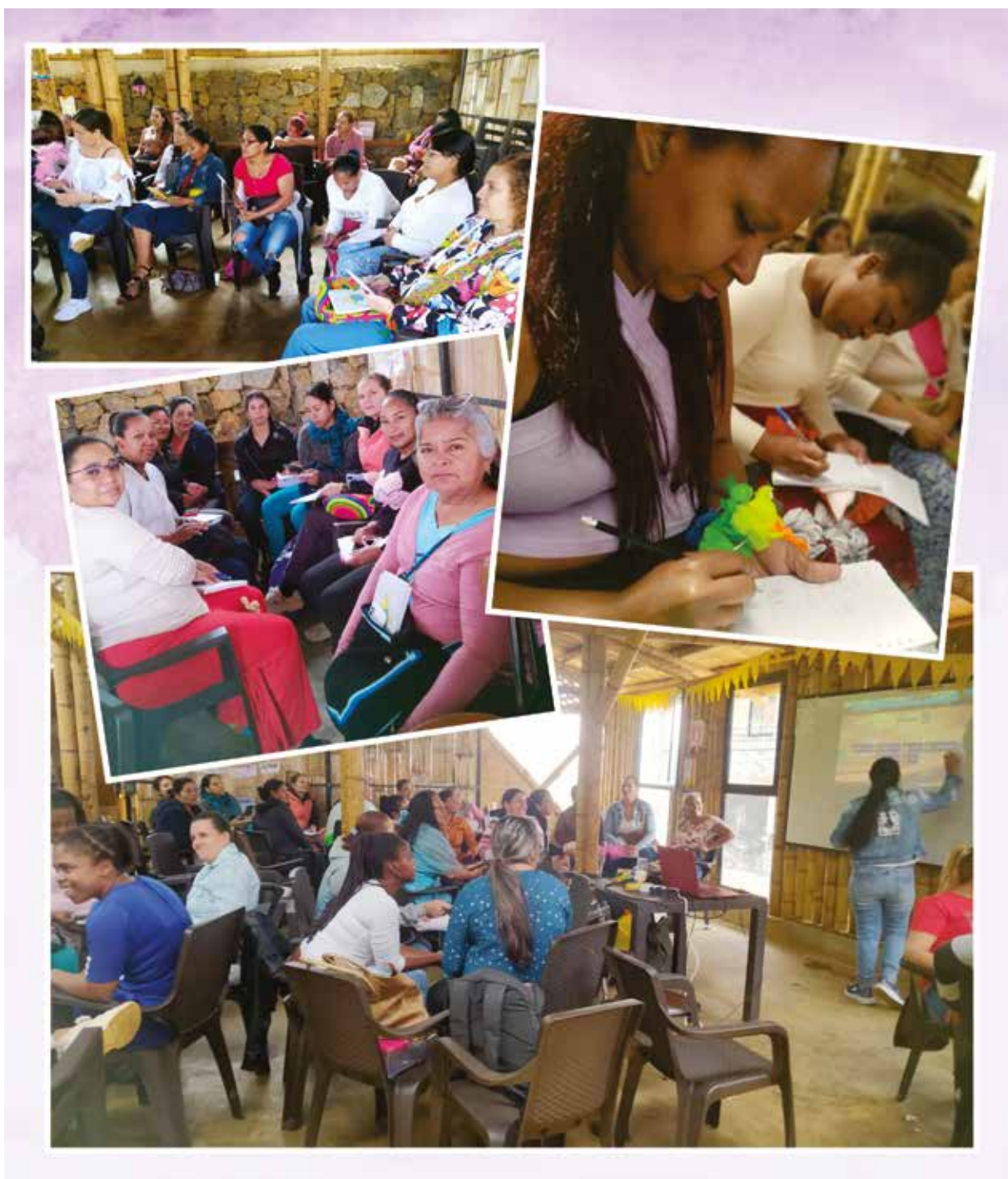
Collage de diversos momentos formativos con el grupo de participantes del proyecto Autónomas

Por todo ello, la tarea debe sostenerse, continuar y avanzar con estrategias enfocadas en la productividad, la identificación de fortalezas y potencialidades para avanzar en el auto conocimiento y la auto aceptación de las mujeres, ahora, más que siempre.