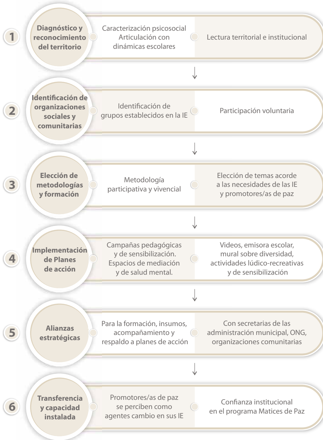
Cuadro: Recuperación del Proceso educativo